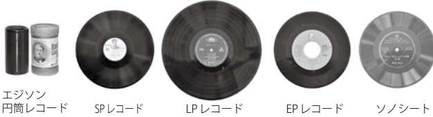
エジソン 円筒レコード SPレコード LPレコード EPレコード ソノシート