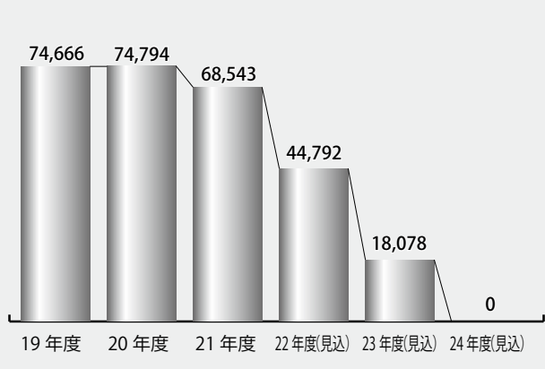
■図4 基金保有額(万円)