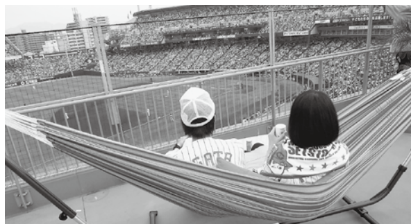
カープ応援ツアーのようす

スタッフは登録制で、イベント内容を検討する会議に出席します。イベント当日には参加者兼スタッフとして、他の参加者をリードしながら運営に関わります。本年度は「カープ応援ツアー(仮)」(6月26日開催予定)などを予定しています。