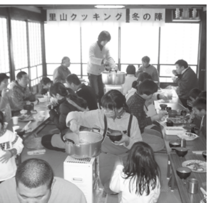
食事を楽しむ参加者

これからも、春・夏・秋と季節に応じた企画を予定しています。皆さんも一緒に参加してみませんか。お問い合わせは、社会福祉課障害者福祉係(80824731210)まで。