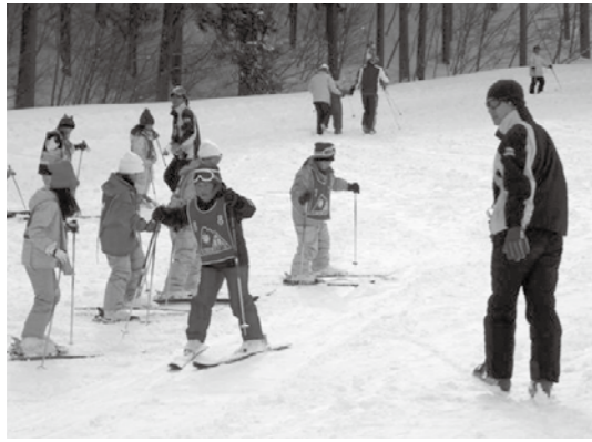
緩斜面で止まる練習をする参加者