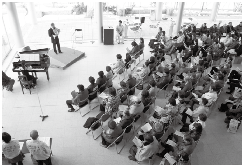
市民ホールに優しい音色が響きわたる

毎月第4月曜日に、市内出身またはゆかりのある演奏家が、その卓越した演奏技術で至福の旋律を奏でます。