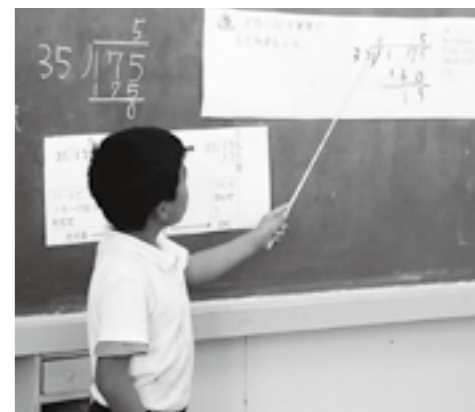
自分の考えを説明しているところ

学力調査結果一覧から、小・中学校の児童生徒の学力は概ね定着していることが分かります。小学校では、「基礎」にかかわる内容は概ね定着しており、特に、低学年では十分定着しています。中学校でも、「基礎」にかかわる内容は概ね定着しています。課題としては、小・中学校とも、「活用」にかかわる内容において学力を伸