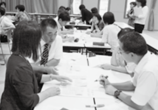
活発に意見を交わす研修会参加者

がら振り返りをさせたりすることなどを通じて、各校で授業の終末10分間の充実を図っていきます。