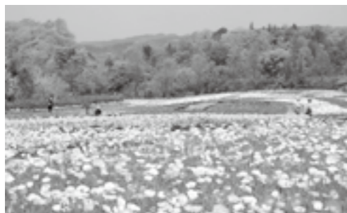
アイランドポビー

いらしい表情をぜひご覧ください。 今年は新たに「ネモフィラの丘」が新登場します(第2駐車場から徒歩3分)。 淡いブルーの花が愛らしいネモフィラの花景色も、どうぞご覧ください。 ●主な花の見ごろ ネモフィラ 30万9千本 4月下旬～5月下旬 ワスレナグサ 11万1千本 4月中旬～6月中旬 ハナビシソウ 11万5千本 5月中旬～6月上旬 アイスランドポビー 10万2千本 5月上旬～6月上旬