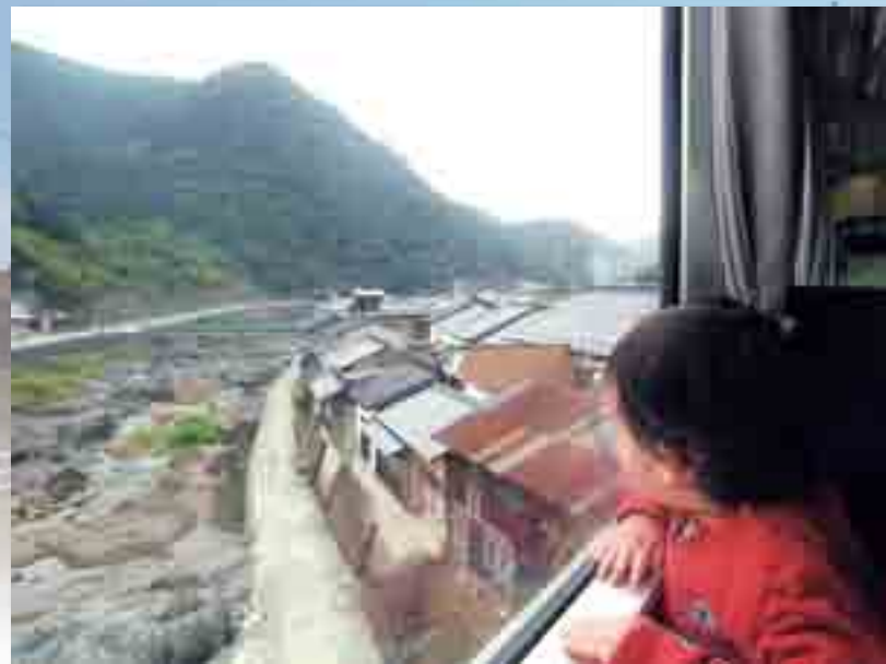
眼下に迫る西城川に夢中 (平成24年10月14日撮影)

「寝とる〜」。車内でうとうとしていた乗客を見て、息子が言いました。少し残念そうでした。どうやら芸備線の魅力を眠らずに満喫してほしかったようです。