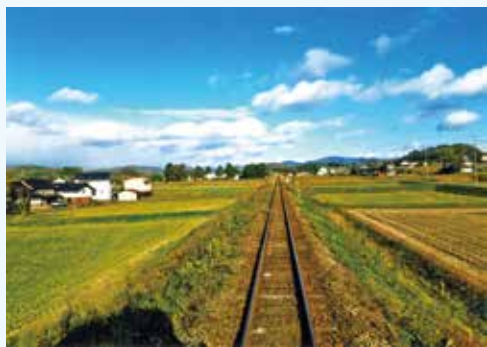
【審査員特別賞】「マルコの空」 山根 リエ(東広島市)