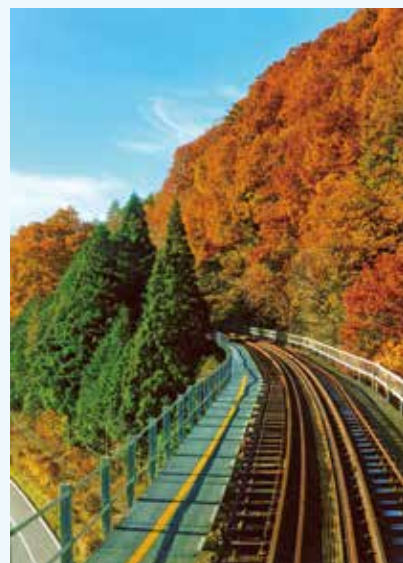
【銅賞】「晩秋の小鳥原第一鉄橋」 赤木 英人(東城町)