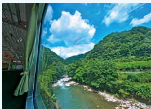
【銀賞】「いつか見た、夏の絶景」 田中 瑛三(岡山県)