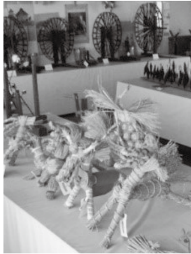
▲同資料館に展示している「わら馬」

トラヘイとは、*来訪神行事の一つで、家内安全、商売繁盛、牛馬繁栄、五穀豊穰などを願い、わら馬と食べ物を交換する行事です。地域によって呼び名はさまざまですが、江戸時代の書物「芸藩通志」には「とろべい」と記載されており、全国各地で行われていました。この行事の多くは途絶えています。この口和町では地域の青年部や子ども会などによって現在も行われています。