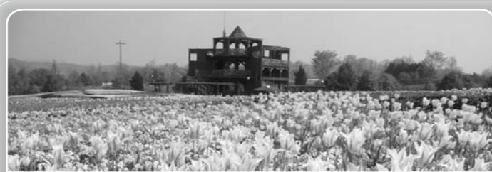
備北公園管理センター ☎0824-72-7000 (http://www.bihoku-park.go.jp/)

春の花とイベントを楽しむ「春まつり」が始まります。期間中は週末を中心にイベントを開催します。花とイベント、遊びを満喫してみませんか？