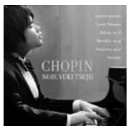
辻井伸行 「マイ・フェイス・アット・ショパン」 (ライブ・クラシック)

ピアニスト辻井伸行さんの母。伸行さんが生後まもなく全盲とわかり絶望と不安のなか、育児書や子育てマニュアルが全く役に立たないところから、手探りで子育てをスタート。持ち前のポジティブさと行動力で常に子どもの可能性を信じ、よく見て、ほめる「親ばか」の子育てで、伸行さんを育てる。生後8か月で伸行さんの音楽の才能を見つけプロのピアニストへと二人三脚で歩む。その結果、平成21年6月、アメリカで開催された第13回ヴァン・クライバーン国際ピアノコンクールで日本人初の優勝を果たす。 自らの子育ての経験をもとに、教育者や親御さんにとって関心の高い内容を明るく楽しく講演します。