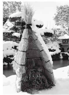
ひばの里「さとやま屋敷」