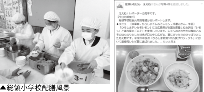
▲総領小学校配膳風景

投稿にはいつも多くの『いいね！』をいただいています。皆さんの関心の高さを改めて感じ、身の引き締まる思いです。今後ともご意見・ご理解・ご協力をよろしくお願いいたします！