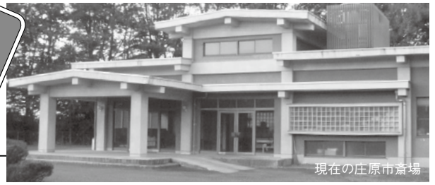
現在の庄原市斎場