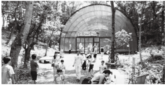
カブトムシドーム