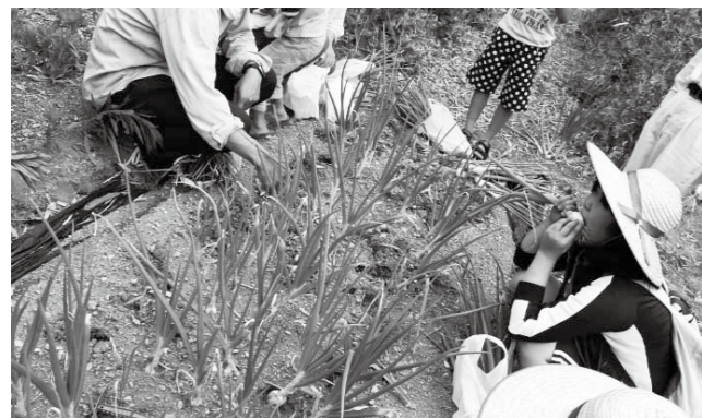
▲玉ねぎを収穫する参加者