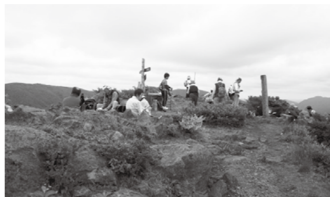
▲吾妻山山頂に憩う登山客

山頂まで登った登山客は「景色が最高で気持ちがいい。また来年も訪れたい」と新緑の吾妻山を満喫していました。