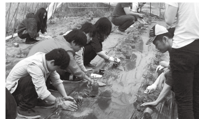
▲トマトの苗を植える学生たち

男子学生は「トマトを使ったメニューをできるだけ早く開発し、庄原の皆さんはじめ、多くの方々に味わっていただきたい」と意気込みを語っていました。