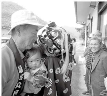
新調した獅子舞ががぶり(亀谷自治会)

市内の自治振興区や自治会などが、宝くじを財源とするコミュニティ助成事業の採択を受けて、備品を整備しました。この事業は、地域コミュニティ活動の促進とその健全な発展を図ることを目的に、一般財団法人自治総合センターが行う事業で、前年度の9月ごろから募集が行われます。平成26年度は9件のうち次の3件が採択され、それぞれの地域では地域活動の基盤の整備が図られ、地域のコミュニティづくりに役立てられています。