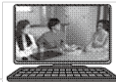
Web-TAX-TV 「暮らしを支える税を学ぼう」

国税庁ホームページのインターネット番組「Web-TAX-TV」で、国税庁の取り組みを紹介する番組を配信しています。ぜひご覧ください。