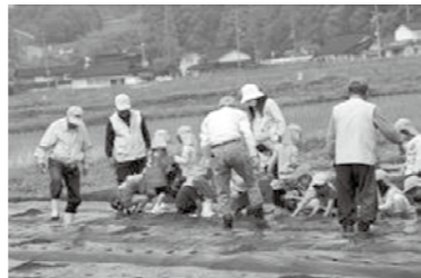
「おいちゃん、これでいいん？」と植え方を教えてもらっています。

子どもたちの中には野菜嫌いもありますが、自分たちが植えた野菜の成長を見ながら「これは僕が植えたんだよ。私が植えたのがこんなに大きくなっているよ」と興味を持ち、収穫して食べることで、食べたいものや好きなものが増えてきています。