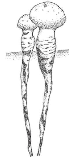
ナガエノスギタケ

十数年前、博物館友の会の行事「キノコ観察会」に参加したときのことです。白くきれいなキノコを発見したので、採ろうと思いましたが、なかなか採れないのです。指で掘ってみると、そのキノコは地中に根を長く伸ばしているのです。とうとう引きちぎって持ち帰りました。