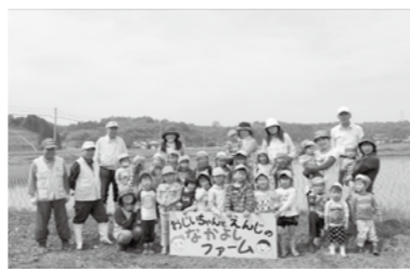
「今年もとうもろこしやさつまいもがいっぱいできますように」と願いを込めて…

また、保育所の給食は野菜がたくさん使われており、野菜が苦手だった子も「給食おいしい!」と自分から食べるようになってきています。「しっかり遊んでしっかり食べ、元気な子どもになってほしい」と願って『食育』に取り組んでいます。