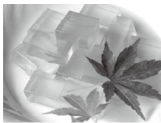
夏のお菓子 梅寒天