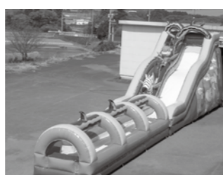
ジャングルウォータースライダー

「パワーバドラー」「アークアチューブ」※有料 開催期間 8月24日(日)まで 利用時間 9時30分~17時 ところ エントランスセンター 国兼前 新登場! 「ドラゴンシャワー」 開催期間 8月31日(日)まで 利用時間 9時30分~17時 ところ 中の広場 大人気! 「ジャブジャブ池」 開催期間 8月31日(日)まで 利用時間 9時30分~17時 ところ 備北オートビレッジ