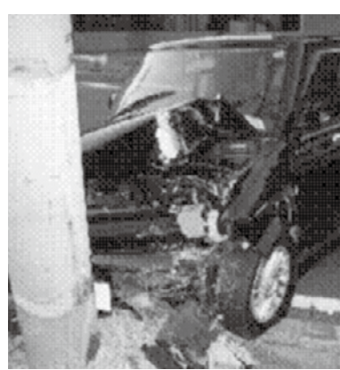
▲飲酒運転による交通事故(2人負傷)