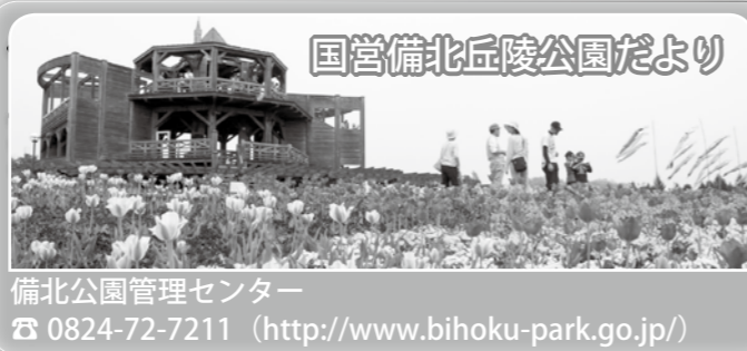
備北公園管理センター ☎ 0824-72-7211 (http://www.bihoku-park.go.jp/)