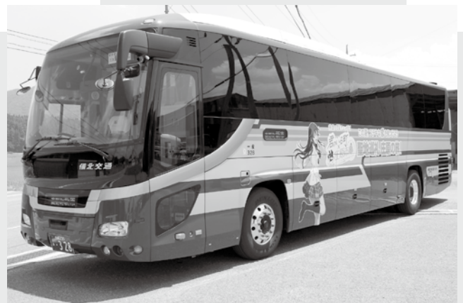
▲キャラクターがラッピングされた高速バス

車体のラッピングには、「君のいる町」のメインキャラクター枝葉柚希(えばゆずき)のイラストや、「聖地巡礼・庄原の旅」の文字を入れて、アニメの舞台となった庄原市をPR。そのほか、「道の駅たかの」など観光拠点施設では等身大パネルを設置し、聖地巡礼パンフレットやチラシを配布するなど、観光客の回遊を仕掛けていきます。