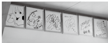
▲たかの温泉神之瀬の湯に設置された声優のサイン色紙

◀観光施設4カ所以上で等身大パネルまたはARのキャラクターと記念撮影した方には、「君のいる町」の特製クリアファイルを先着300人にプレゼント ※AR(拡張現実)とは、スマートフォンなどの画面に仮想的に作られた画像などの情報を重ねて実物と一緒に表示する技術。