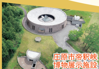
庄原市帝釈峡 博物展示施設