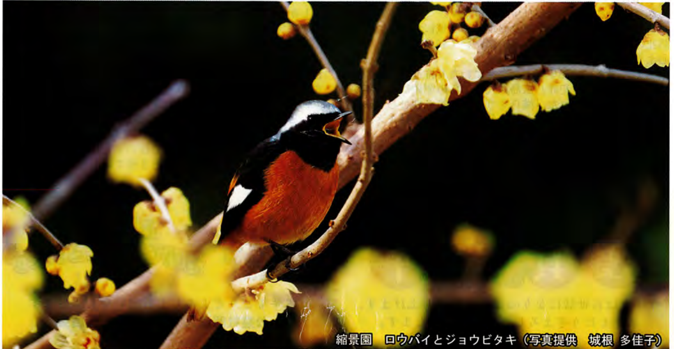
縮景園 ロウバイとジョウビタキ

『防犯ひろしま』は広島県防犯連合会のホームページ( https://bouhan-hiroshima.jp )でも閲覧(印刷)ができます。