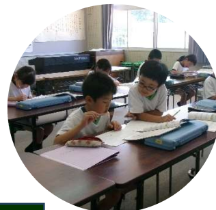
5月19日(火) 学校訪問 (口和小)