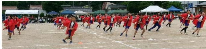
5月24日(日) 運動会 (東城小)