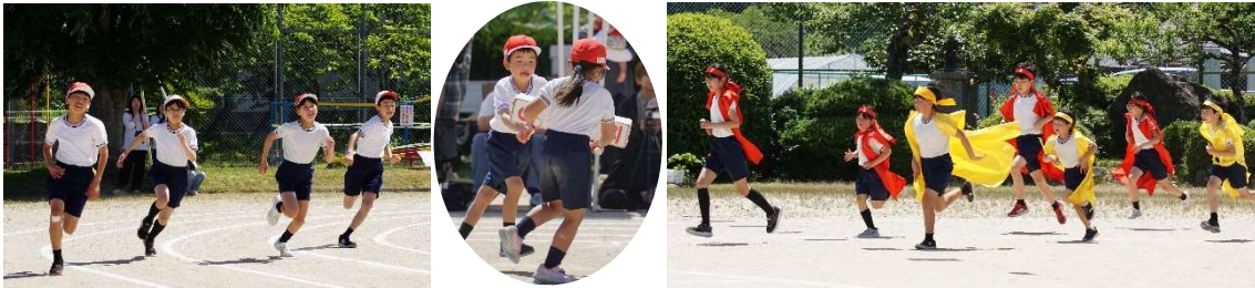
5月17日(日) 運動会 (高小)