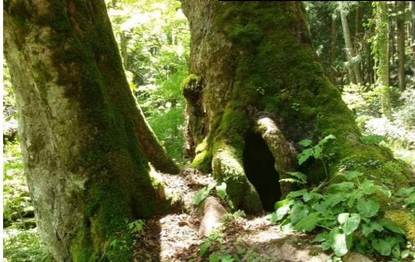
5月5日(祝) 国天然記念物 熊野の大トチ (西城町)