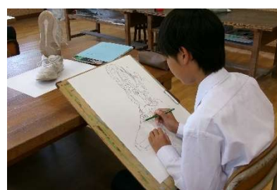
5月19日(火) 学校訪問 (口和中)