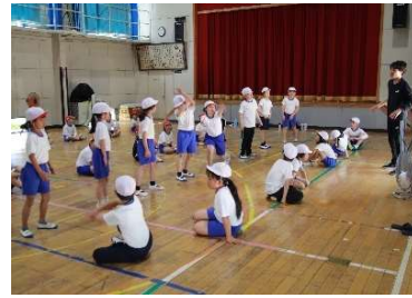
5月7日(木) 学校訪問 (永末小)