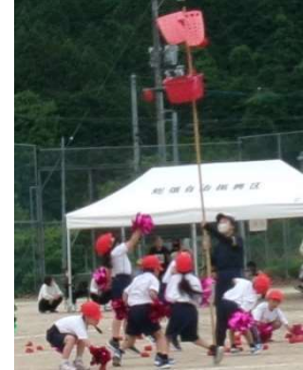
5月23日(土) スポーツフェスティバル (総領小)