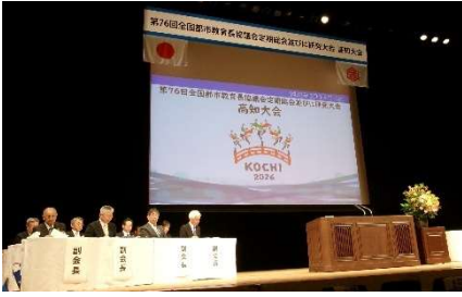
定期総会・研究大会

5月14日(木) ～ 15日(金) 第76回 全国都市教育長 協議会(高知大会)