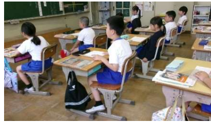
5月21日(木) 学校訪問 (山内小)