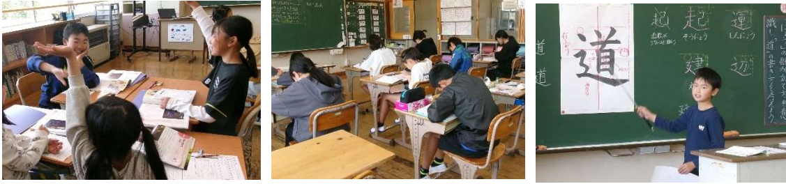
5月12日(火) 学校訪問 (高野小)