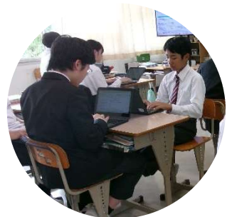
5月20日(水) 学校訪問 (西城中)