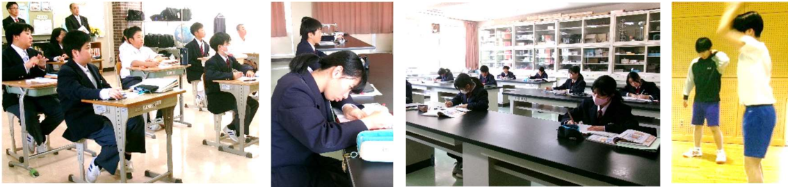
5月12日(火) 学校訪問 (高野中)

5月14日(木) ～ 15日(金) 第76回 全国都市教育長 協議会(高知大会)