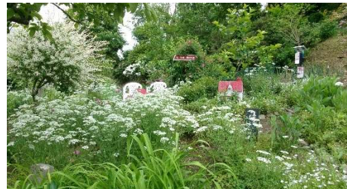
5月23日(土) 庄原さとやまオープンガーデン 祢宜庭 (板橋町)