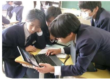
5月7日(木) 学校訪問 (東城中)