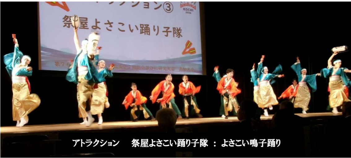
アトラクション 祭屋よさこい踊り子隊：よさこい鳴子踊り