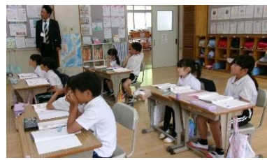
5月20日(水) 学校訪問 (西城小)