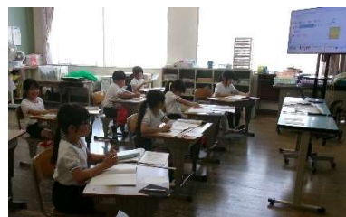
5月20日(水) 学校訪問 (高小)