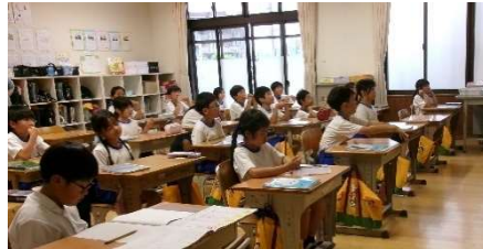
5月21日(木) 学校訪問 (庄原小)