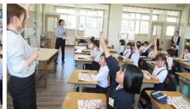
4月20日(月) 学校訪問(東小)