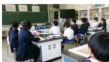
4月20日(月) 学校訪問(板橋小)