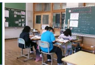
4月16日(木) 学校訪問 (比和小)