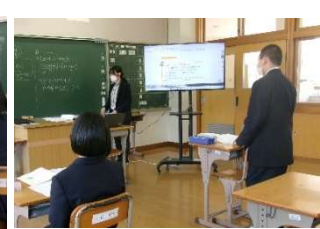
4月16日(木) 学校訪問 (比和中)