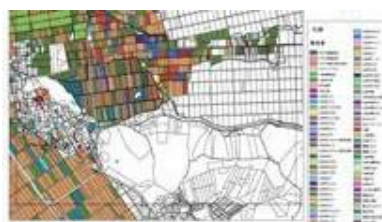
デジタルマップ策定