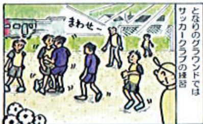
とりのグラウンドではサッカー部の練習