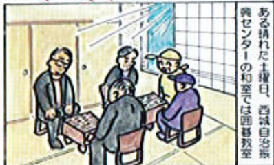
ある朝の土曜日、西城自治振興センターの和室では西城教頭