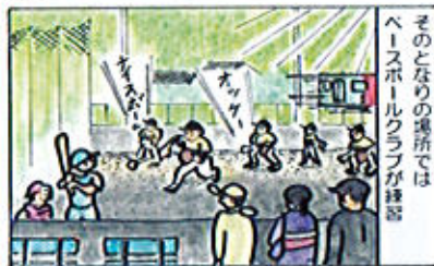
そのとりのグラウンドではベースボールクラブが練習