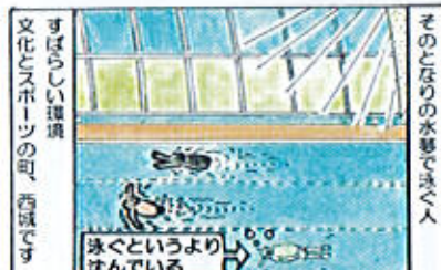
そのとりの水場で泳ぐ人