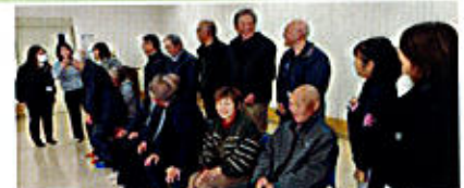
令和7年度最後の「西城暮らしと安心の会」の集合写真撮影前の一コマ

各自治会長と関係機関(民生児童委員、ひとり暮らし高齢者等巡回相談員、包括支援センター、社協)との交流会開催について。目的は関係機関の顔つなぎの場とする。西城暮らしと安心の会や振興区の活動、関係機関の役割を知る事。相談窓口の周知を行う事。災害時の情報共有の場とする。など、参加者は共有しました。また、防災について、各自治会での取り組み状況などが話されました。