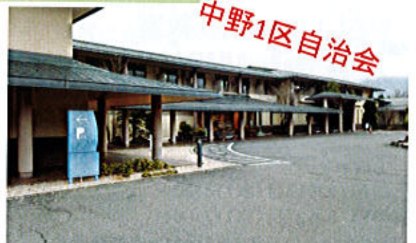
亀嵩温泉玉峰山荘