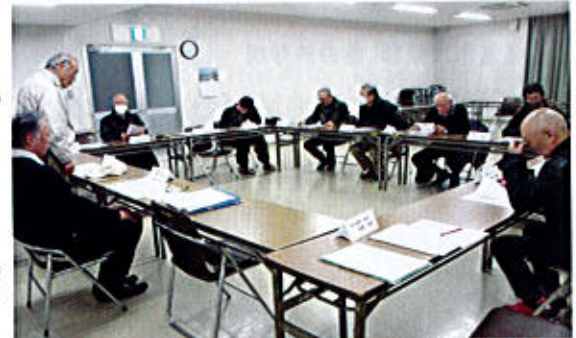
役員会の様子(総務広報部会は役員が兼ねる)