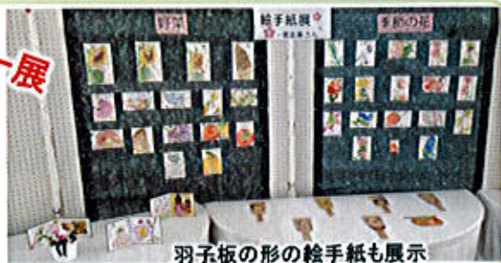
羽子板の形の絵手紙も展示