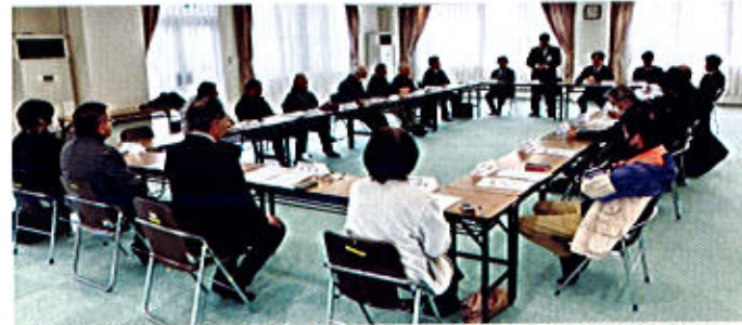
参加人数23人 ※ 資料:「概要版 第3期庄原市長長期総合計画(素案)」配布