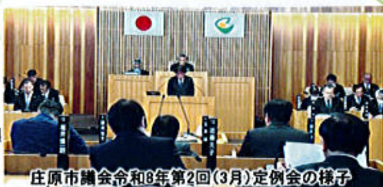
庄原市議会令和8年第2回(3月)定例会の様子