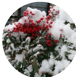
ナンテンの木 (南天)に積雪