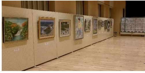
11月16日(日) 第21回庄原市美術展覧会鑑賞