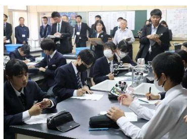
10月28日(火) 東城中訪問 公開研究会 授業参観・協議会