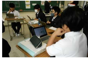
10月21日(火) 西城中訪問 公開研究会 授業参観・協議会