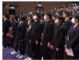
11月13日(木) 令和7年度(第8回)庄原市中学校合唱コンクール開催