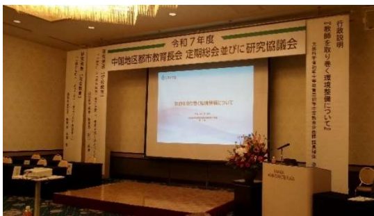
10月30日(木)・31日(金) 中国地区都市教育長会協議会(浜田市)