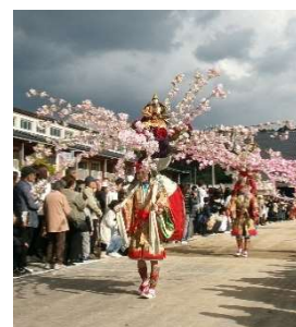
11月2日(日) 第32回備後東城 お通り(東城町)