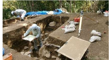
11月6日(木) 甲山古墳 第3次発掘調査 (上原町)