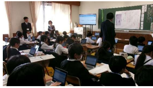
11月5日(水) 庄原小訪問 第2回庄原市情報教育研修会