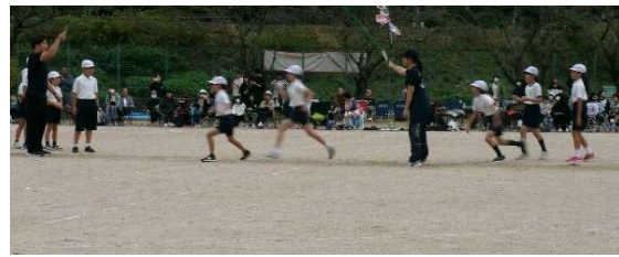
10月26日(日) 西城小訪問 運動会