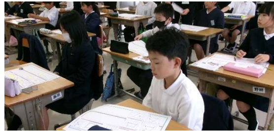
11月20日(木) 東小訪問 公開研究会 授業参観・協議会