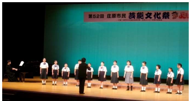
8月24日(日) 芸能文化祭「合唱」 (庄原児童合唱団)(ジュニア合唱団やまびこ)