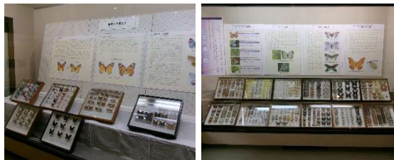
8月13日(水)「多様で美しい蝶と蛾の世界」 (比和自然科学博物館特別展)