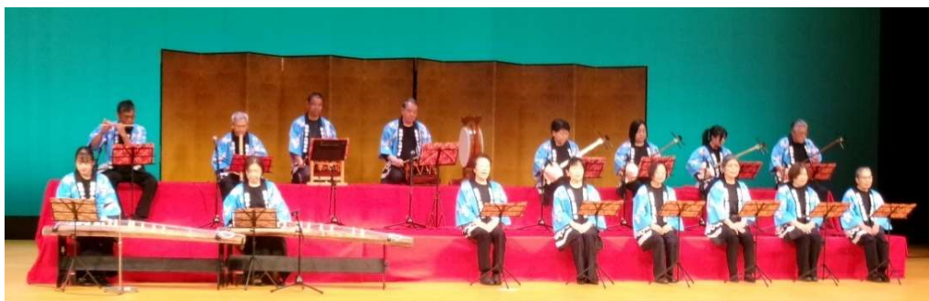
8月24日(日) 芸能文化祭「庄原民謡 敦盛さん」(敦盛さん保存会)