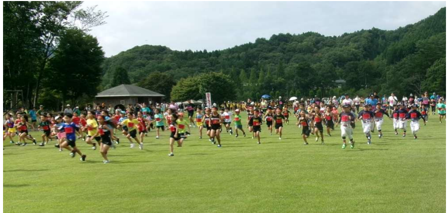
8月23日(土) 第26回ひろしまクロスカントリー大会 (道後山高原クロカンパーク)