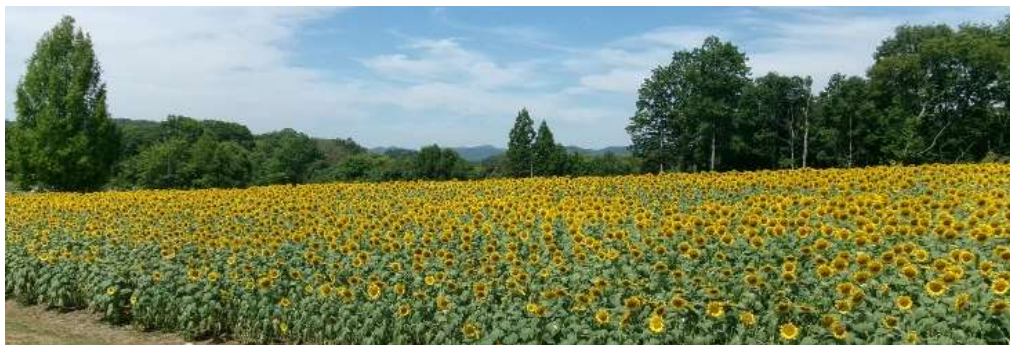
8月3日(日) 真夏の5万本のひまわり (備北丘陵公園)