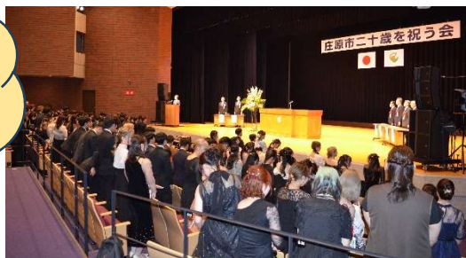
8月15日(金) 令和7年度「庄原市二十歳を祝う会」 参加者 196人