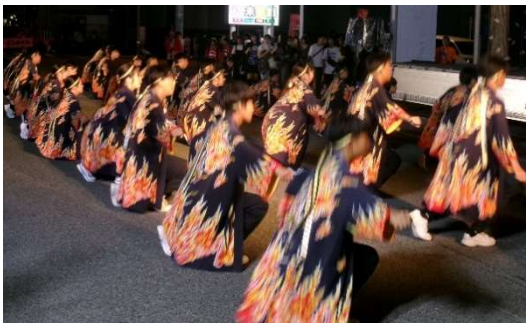
8月23日(土) 庄原よといこ祭パレード 「威舞希」(庄原中)