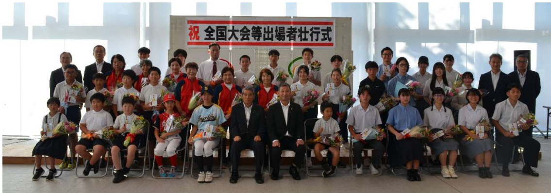
7月22日(火) 令和7年度全国大会等(夏季)出場者壮行式