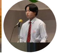
8月22日(金) 令和7年度庄原市中学生意見発表大会 (ふれあいセンター)