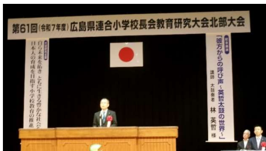
8月7日(木)第61回広島県連合小学校長会教育研究大会 (庄原市民会館)