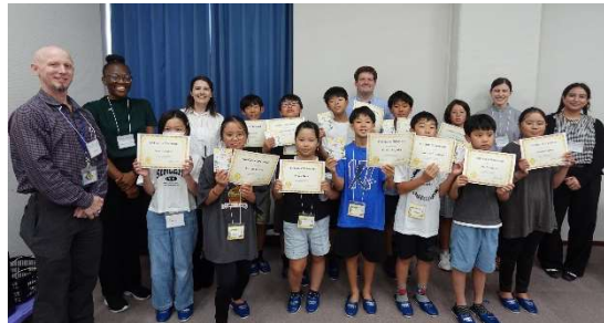
8月7日(木) 小中学生イングリッシュ・キャンプ 参加者26人 (体育館会議室)