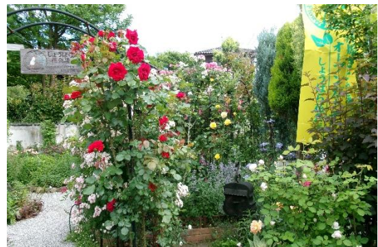
5月25日(日)東本町 佐藤庭 庄原さとやまオープンガーデン