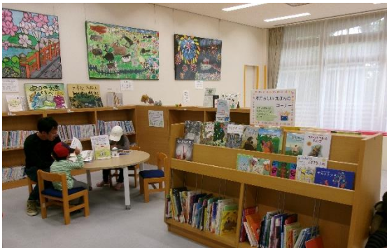
5月25日(日)親子で本読み 田園文化センターキッズスペース