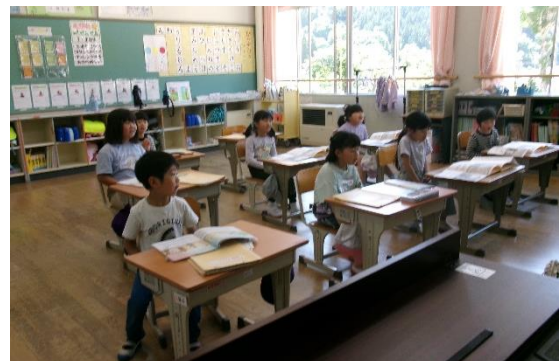
5月27日(火)比和小訪問