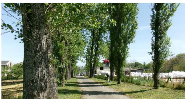
5月5日(祝) 第58回 春の七塚原写生大会