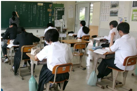
5月20日(火)西城中訪問