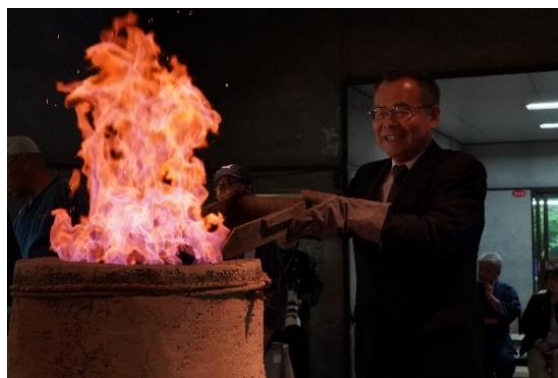
5月11日(日) 古代たたら鉄づくり