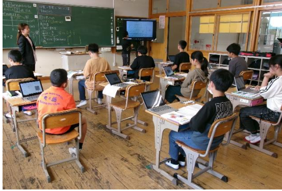
5月19日(月)高野小訪問