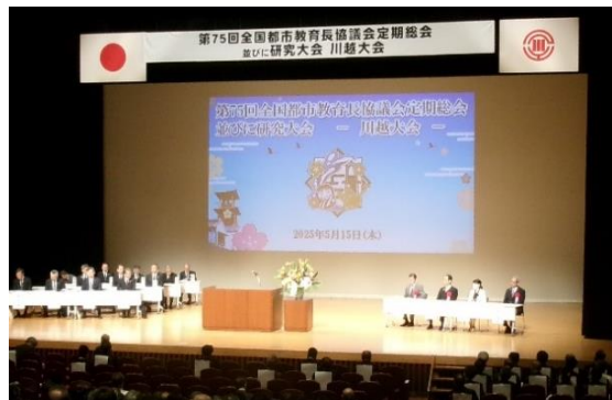
5月15日(木)・16日(金) 全国都市教育長協議会(埼玉県川越市)