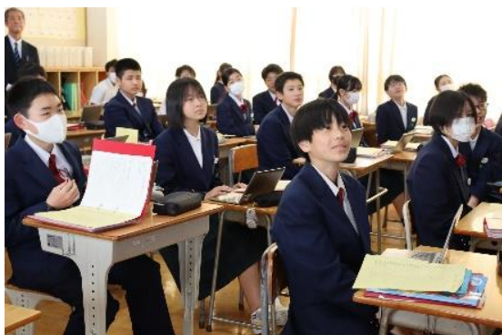
5月7日(水) 庄原中訪問