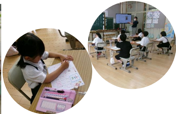
5月20日(火)西城小訪問