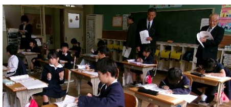
山内小 学校運営協議会 授業参観

1つ目は、「本の読み語り活動」のことです。それぞれの学校でやり方は違っていますが、子供たちが本を好きになり少しでも多くの本を手にとって読んでみたくなるような取り組みをしています。読み語りをするのは、高学年や子供司書、図書委員をはじめ、教員や地域の読書ボランティアの皆様など、いろいろな人が行っています。子供たちが本の扉を開き、新しい世界に入り込み、豊かな体験をいっぱいしてほしいと思っています。