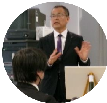
4月30日(水) 初任者研修会「子供たちに確かな力を付ける」