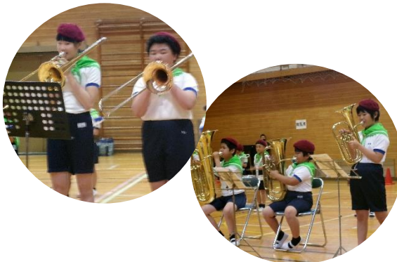
5月24日(土)小奴可小 運動会 金管鼓笛演奏