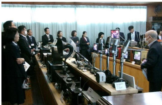
5月12日(月) 口和郷土資料館訪問 (校長会)