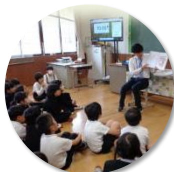
庄原小 読み語り活動