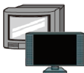
テレビ (ブラウン管・液晶・プラズマ式のもの)