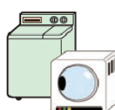
洗濯機・衣類乾燥機