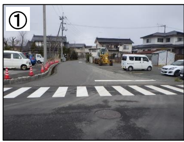
ゾーン30路面表示【予定】