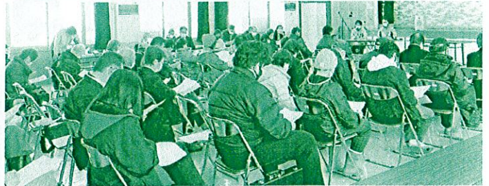
事業報告の様子。今年度は視察研修旅行も行う予定です♪

道の駅たかのは開業してまもなく10年を迎え、全国には1,198駅もの道の駅が存在し、今後も新しい道の駅が誕生していきます。お客様に何度もお立ち寄りいただくためには、マンネリ化対策、時代や流行に合わせた商品の開発も必要です。パッケージデザイン等なかなか個人では難しいことでもサポートできる体制が道の駅には整っていますので、「こういうものを出荷してみたいんだけど」といったご相談も随時お待ちしております！