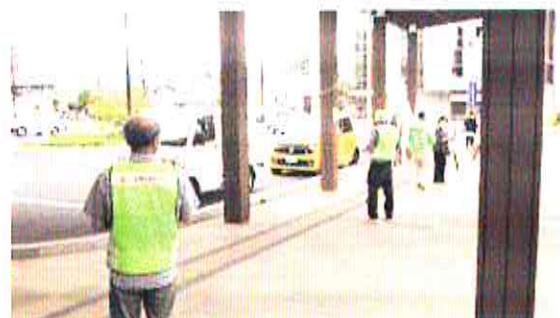
【廿日市】特殊詐欺被害防止の街頭キャンペーンを実施（7月21日）

呉市防犯連合会天応地区では、児童生徒の下校時の安全を見守るために有志約70人で「天応地区若竹見守り隊」を結成し、5地区に分けた当番制で下校時の児童生徒の安全を見守り続けています。