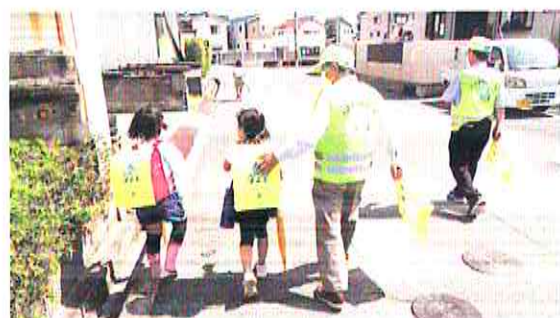
【呉】下校時の児童生徒の見守り活動を継続実施（6月22日）

広島南防犯連合会は、警察署や企業と連携し、年金支給日に合わせて、特殊詐欺被害防止キャンペーンを行い、ATM利用者に被害防止を呼びかけながら、チラシやグッズを配付しました。