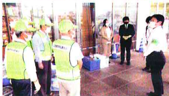
【広島南】特殊詐欺被害防止キャンペーンを実施（6月15日）

http://www.enjoy.ne.jp/bouhan E-MAIL bouhan@do5.enjoy.ne.jp