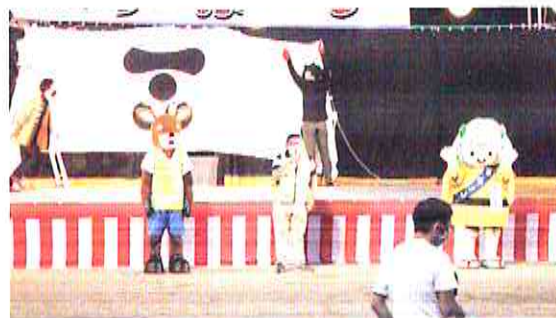
【安芸高田】一心祭り防犯キャンペーン（7月16日）

竹原警察署管内防犯組合連合会は、警察署と合同で、「管内から特殊詐欺の被害者を出さない！」という決意のもと、年金支給日恒例のATMキャンペーンを新しい生活様式に則した方法で実施しました。