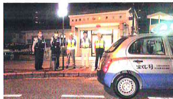
【尾道】夜間の青色防犯パトロールを実施（8月11日）

安芸高田市防犯連合会は、警察署、市暴力監視追放協議会と合同で、毎年7月に行われる「一心祭り」において、防犯キャンペーンを実施しました。減ら犯マスコットキャラクター「モシカくん」と市公式マスコットキャラクター「たかたん」も参加し、子どもを中心に盛況でした。