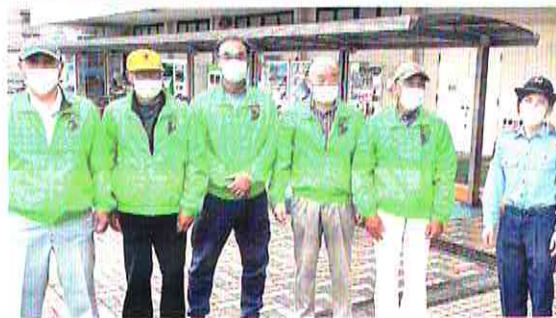
【竹原】特殊詐欺被害防止！ATMキャンペーンを実施（6月15日）

竹原警察署管内防犯組合連合会は、警察署と合同で、「管内から特殊詐欺の被害者を出さない！」という決意のもと、年金支給日恒例のATMキャンペーンを新しい生活様式に則した方法で実施しました。