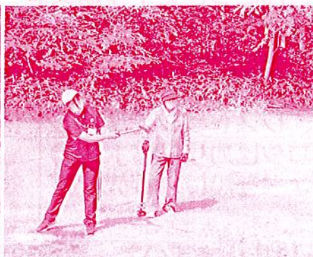
初めてのスタッフにも丁寧に指導していただき、プレーも出荷者さんとの交流も楽しくできました♪