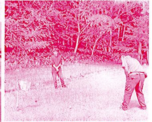
口和町からも多くの出荷者さんにご参加いただきました！