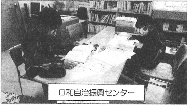
口和自治振興センター