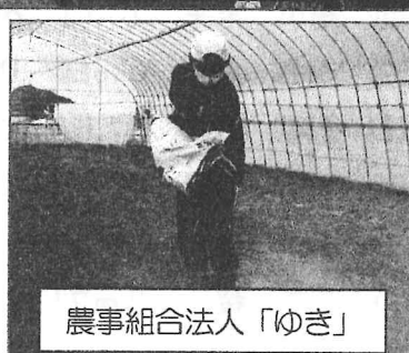
農事組合法人「ゆき」