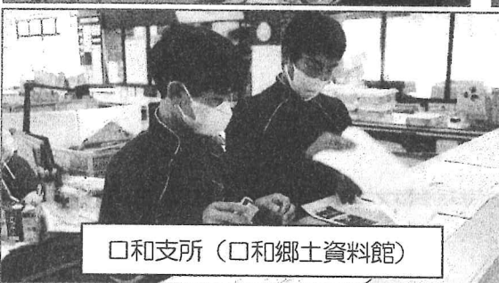
口和支所（口和郷土資料館）