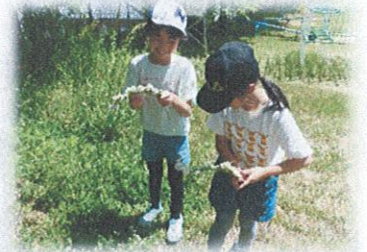
シロツメクサでかんむりを作っています

休憩時間には、校庭でブランコをしたり、シーソーをしたり、鉄棒、野球、一輪車、草花遊び等々、楽しく過ごす子供達をたくさん見ることができます。1年生から6年生、ほとんどの児童が参加して鬼ごっこをしていることもあり、高学年のリーダーシップと優しさに感謝しています。