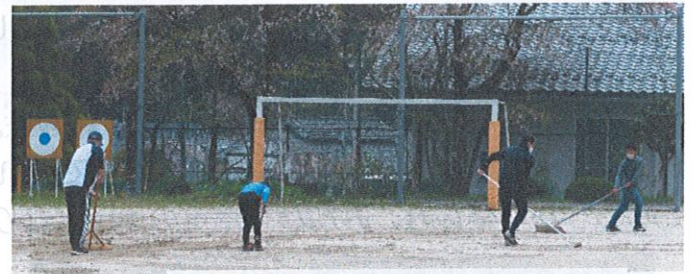
グラウンド整備をしてくれる児童