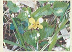
ダイセンキスミレ