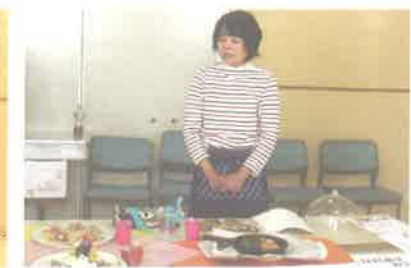
各店舗のメニュー紹介にも力が入ります