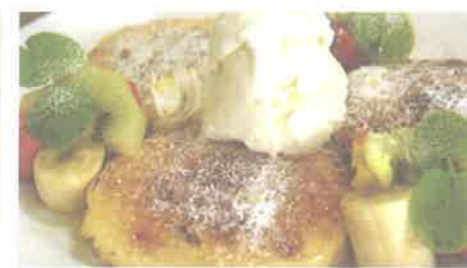
講師による試作品、見た目も味もさすがでした