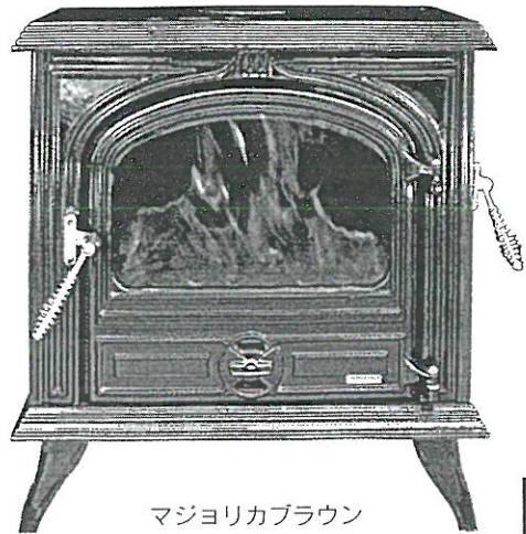
マジヨリカブラウン

The traditional stove which continues being loved more than the time of commencement of business