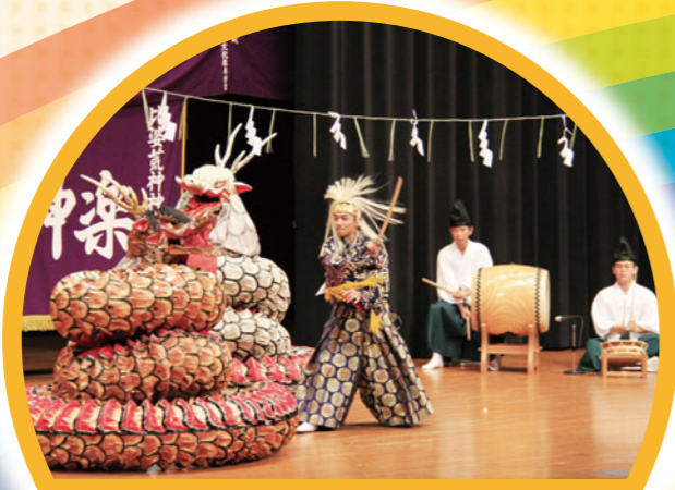
伝統行事を受け継ぐ