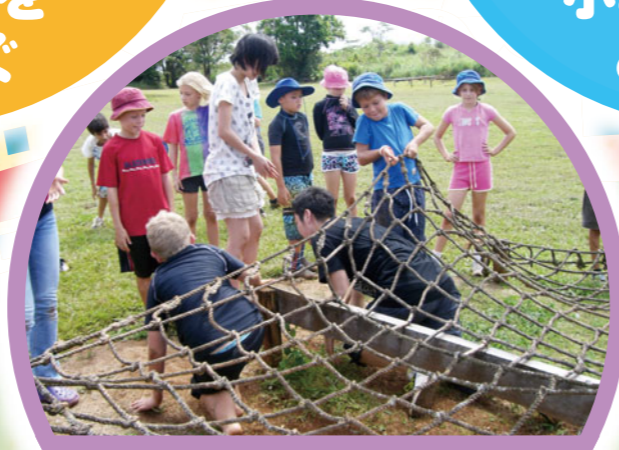
外国の人との交流