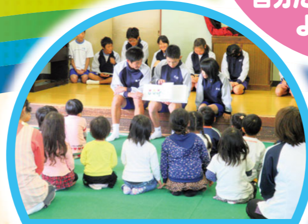
小さい子どもとの交流