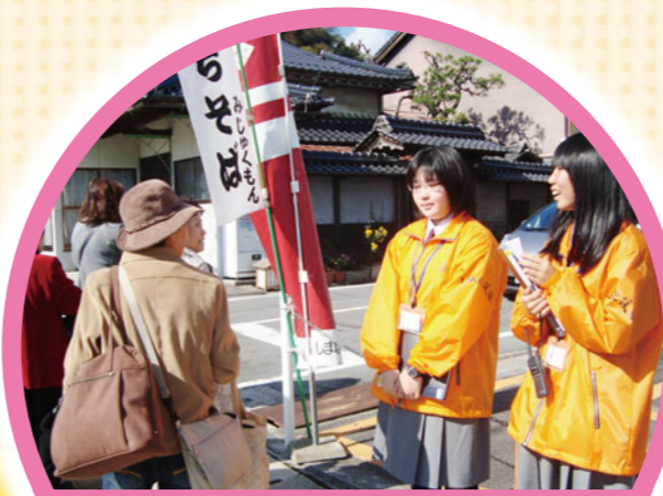
自分たちの暮らすまちのよさを伝える