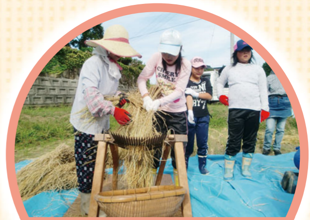
地域の産業を学ぶ