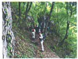
写真は比婆山登山のもので、