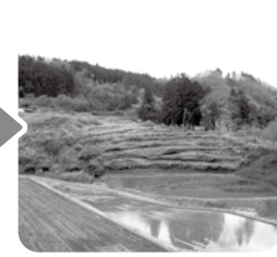
放置森林の整備後