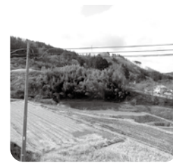
放置森林の整備前