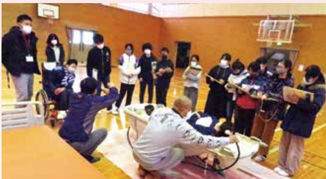
▲訪問入浴の説明を受ける児童

体験を終えた児童は「高齢者の体の不自由さや、介護の大変さがわかった。お年寄りを支えていきたい」と話しました。