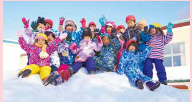
▲雪の上で記念撮影