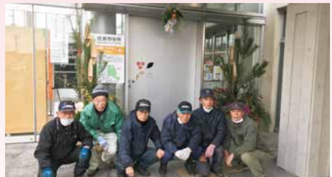
▲しめ縄門松同好会の皆さん