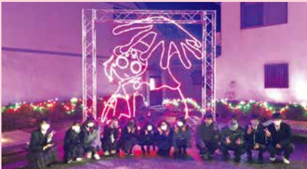
▲「ほろちゃん」のイルミネーションと制作した東城応援隊

このイルミネーションには新型コロナウイルスの早期終息の願いも込められており、訪れた人は「一日でも早く穏やかな日々が戻り、本年はお通りなどのイベントが開催されることを願う」と話しました。