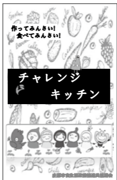
▶チャレンジキッチンの表紙

※チャレンジキッチンとは 塩分控えめ、栄養バランスよく、野菜をより食べてもらうことをテーマとして、食推が作成したレシピ集です。 一人暮らしや時間のない方でも電子レンジを使用した時短レシピや、フライパン一つでできるレシピ、加工食品などを活用した簡単なレシピとなっています。