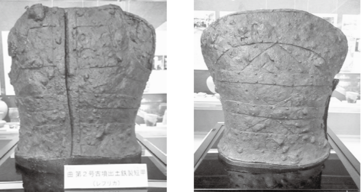
三角板横板併用鉄留短甲(左写真:前面、右写真:背面)

3世紀の中ごろから7世紀までを古墳時代といい、古墳の形には、前方後円墳や円墳、方墳などがあります。 曲第2～5号古墳は、口和町を流れる湯木川に面した丘陵上にある、古墳時代中期～後期の古墳群です。中国横断自動車道尾道松江線の建設に伴って発掘調査が行われ、計4基の円墳が確認されました。中でも第2号古墳は最も大きな規模を持ち、直径13.5メートル、高さは約2.6メートルになります。古墳群からは多数の土器や鉄器、玉類などが出土しており、特に第2号古墳から出土した鉄製の短甲は、市内で初めての発見となりました。 「短甲」とは、上半身を守るために用いられるよろいのことで、古墳時代に使用された武具の一つです。薄い鉄板を何枚も組み合わせ、革紐や釘で留め、人間の胸に合うように製作されています。蝶つがいとつながった前胴が開くようになっており、そこから体を入れて装着していました。県内ではこれまでに11例の短甲が発見されていますが、完全な形に近いものは曲古墳を含めて3例しか見つかっていません。 曲古墳の短甲は、前胴に長方形の横板、後胴に横板と三角形のそれぞれ異なる形の鉄板を使用した「三角板横板併用鉄留短甲」と呼ばれるもので、全国でも13例しか見つかっていない非常に珍しい形式の短甲です。 曲古墳には、短甲のほかにも鉄製の刀や剣、矢尻などが副葬されており、古墳に葬られた人物の軍事的な性格がうかがえます。短甲を製作するためには、材料となる鉄とそれを加工する高度な技術が必要であり、誰でもが持てるものではないことから、畿内政権から配布されたものとされています。 また、この短甲は右前胴を外して左前胴の内側に入れた状態で出土しており、古墳に埋葬される際に何らかの儀礼行為として意図的に前胴を外したと考えられます。