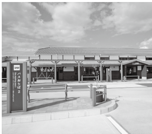
▲駅舎とバス乗降場

またシェルター(バスなどの乗降場に設置した雨よけの屋根)や、乗降場の表示サイン、横断防止柵、歩道部分の色調を淡くし、人工木材を柱などの表面に使用したことにより、大正建築を踏襲した温かみのある雰囲気となっています。