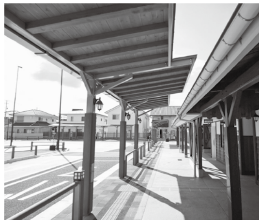
▲レトロな雰囲気シェルター