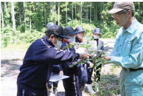
フィールドワークで植物観察

比和自然科学博物館は、教育機関と連携し、学習機会の充実を進める取り組みを行っています。その一つとして、「総合的な学習の時間」の学習支援を行っています。 6月3日、8日には比和中学校1年生に授業を行いました。3日は、吾妻山をはじめとする比和の自然の成り立ちと、自然科学の考え方を紹介しました。8日は比和財産区の山林で植物観察などのフィールドワークを行いました。 今後も比和中学校で、比和町特産のソバの栽培体験や、身近な環境に生息する昆虫の標本作りを行い、自然と生態系について学習します。 その他、比和自然科学博物館は「市内小学校への出張授業」や「博物館見学による学習対応」なども行っています。 地域財産である博物館の収蔵資料や研究成果の活用と、郷土の自然に誇りを持つる学習機会の充実など、教育機関と連携した取り組みを継続していきます。