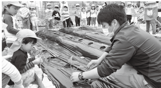
▲苗の植え方の説明を聞く園児