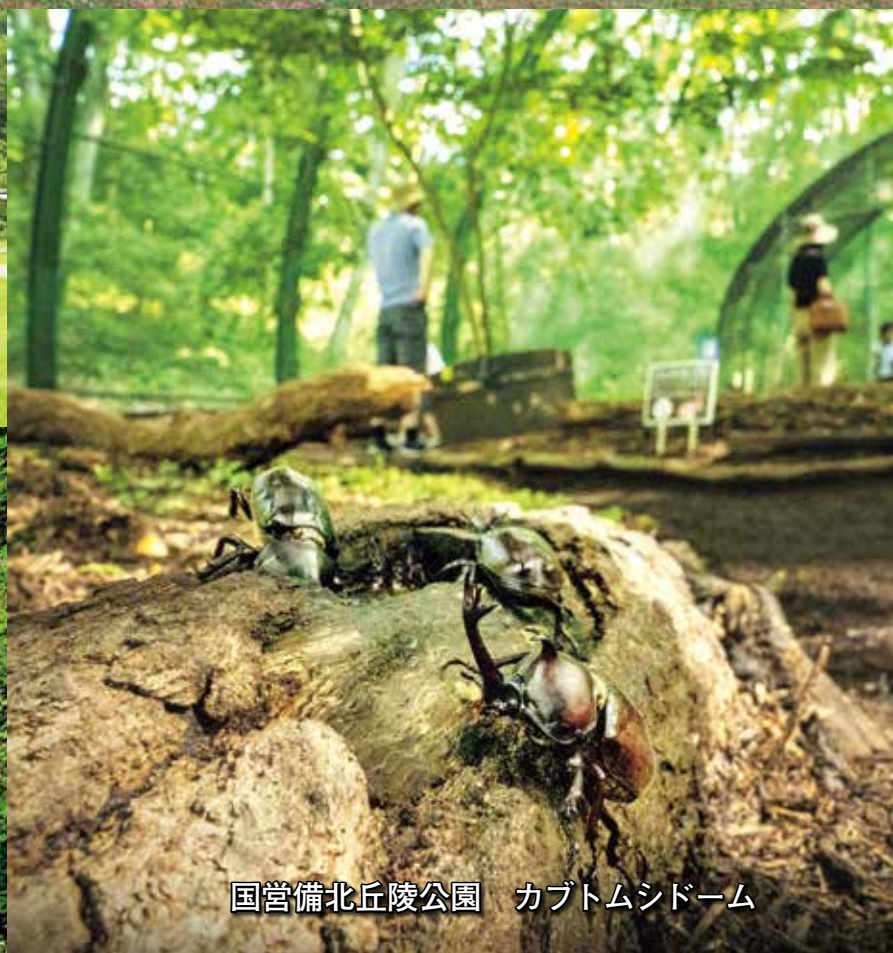
国営備北丘陵公園 カブトムシドーム