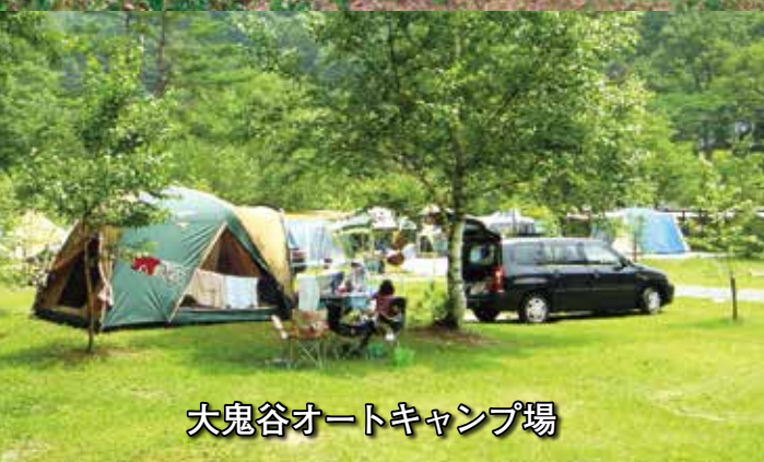
大鬼谷オートキャンプ場