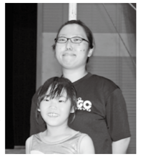
新しいコーチが生まれることです。 大学進学などで一度は庄原を離れることがあっても、故郷に戻ってきて一緒に指導してもらえよう、庄原愛を育てながら、選手育成していきたいと思っています。

このコーナーでは、人と人とのつながりを大切にしながら、自発的なまちづくりに取り組む皆さんをシリーズで紹介していきます。