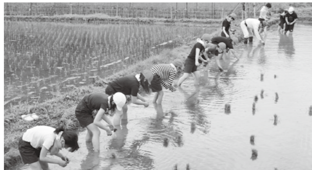
▲横一列になり苗を植える児童

参加した児童は「苗が浮いて流れてしまうので、しっかり埋まるまで植えるようにした。秋には餅つきがしたい」と話していました。