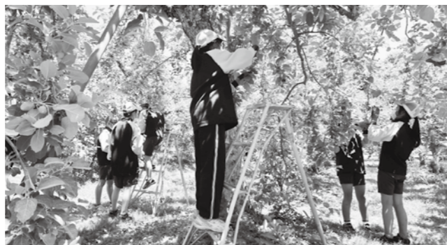
▲熱心に摘果作業を行う児童

これからも月1回のペースで現地学習を行い、11月には道の駅たかのので対面販売を行う予定です。