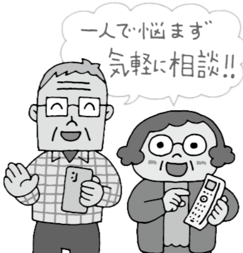
(イラスト出典) 独立行政法人国民生活センター

送り付け商法や、インターネット通信販売に関する相談は、庄原市消費生活センターへ ☎0824・73・1228 平日9時～16時(12時～13時は除く)