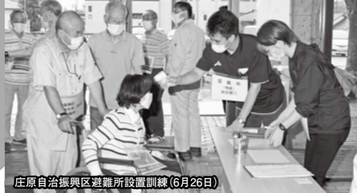
庄原自治振興区避難所設置訓練(6月26日)