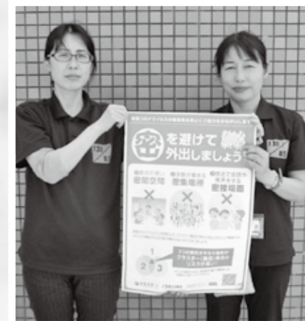
西城支所地域振興室