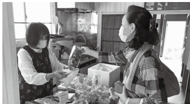
▲マルシェで買い物をする来場者

来場者は「毎月の開催を楽しみにしている。今後もマルシェに参加したい」と笑顔で話していました。