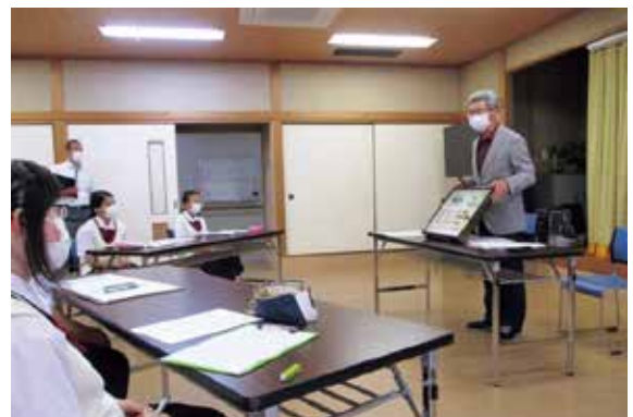
昆虫の標本を使った比和の自然についての授業