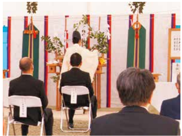
宮司による祝詞奏上