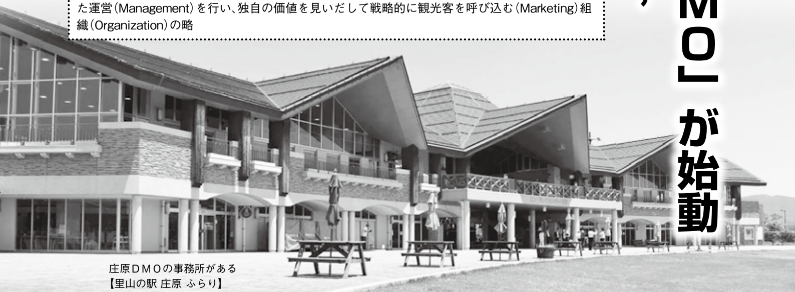
庄原DMOの事務所がある 【里山の駅 庄原 ふらり】

DMO (Destination Marketing/Management Organization) とは？ 観光を切り口に、目的地(Destination)の経済や暮らしを豊かにするため、業種や官民の枠を越えた運営(Management)を行い、独自の価値を見だして戦略的に観光客を呼び込む(Marketing)組織(Organization)の略