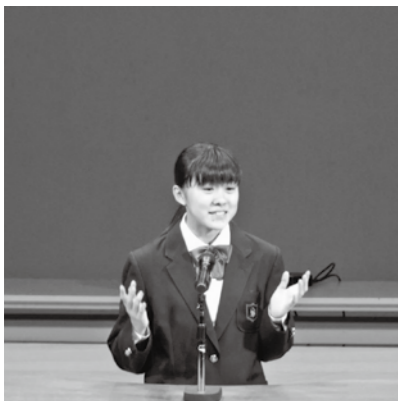
庄原中2年生による英語スピーチ

10月20日、「グローバル化」をテーマに庄原市民会館で教育フォーラムを開催し、約500人が参加しました。まず、庄原小学校6年生が、外国語科(英語)の公開授業を行いました。続いて、庄原中学校3年生が昨年度の修学旅行で取り組んだ、外国人観光客への英語での庄原観光PRについて発表し、その後、2