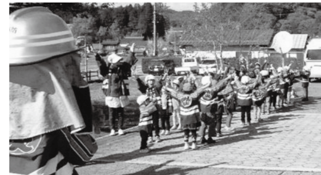
▲高野支所前でダンスする園児たち

途中の保健福祉センターと市役所高野支所ではダンスを踊り、全員で「僕たち私たちは、火遊びはしません」などの防火の誓いを、大きな声で約束しました。