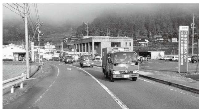
▲パレードの様子(口和方面隊)