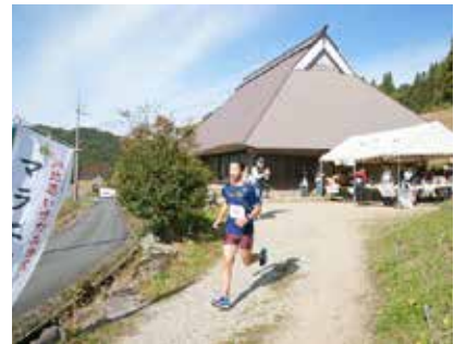
古民家 長者屋(エイド 共通)