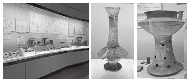
複数機能から初めて勢ぞろいした出土品 脚付長頸壺 注口付脚付鉢

会場では、王墓創出という前例なき革新を、広域連携と試行錯誤を通じて成し遂げた弥生時代の先人の英知と、「悠かに限りなく遠い時」の流れに想いをはせてみてください。