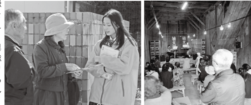
▲見どころを案内する東城応援隊(お通り)