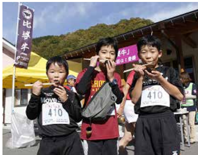
あけぼの荘(エイド 共通)