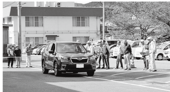
▲サポートカーの機能を体験している様子

体験者は「テレビで見えてはいたが、実際に体験して驚いた。事故を未然に防止できることは重要だと思う。今後の車購入の参考にしたい」と話していました。