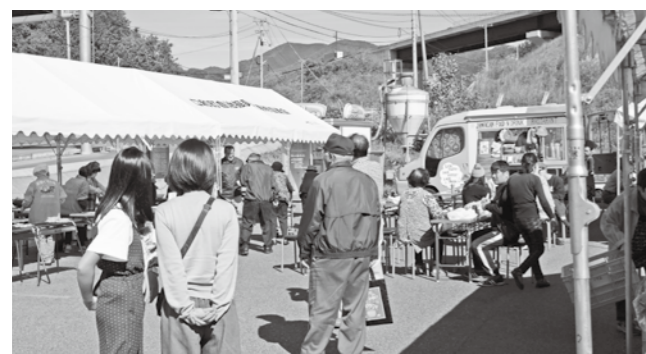
▲地域のグルメを楽しむ来場者

黒岩城址保存会のメンバーは、「黒岩城址について多くの人に知ってもらいたい」と活動に取り組んでいました。