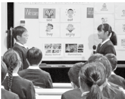
庄原小6年生外国語科の公開授業