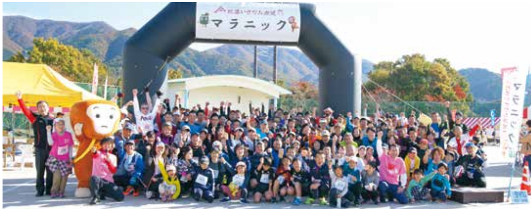
13.73kmの部 スタート前記念撮影

▼エイドステーションの比婆牛がとてもおいしかったので、帰宅途中、購入した ▼エイドが豪華すぎて、地元の皆さんには深く感謝！