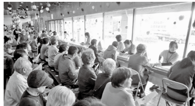
▲健康チェックを受ける来場者

さらに、糖尿病予防の啓発のため11月8日から17日まで庄原赤十字病院と西城市民病院、市役所本庁舎が青色にライトアップされました。