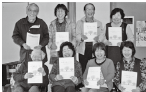
みんなで、いきかたノートを受け取りました

サロン以外にもさまざまな機会です。講座を開催できます。関心を持った方は、まずご相談ください！