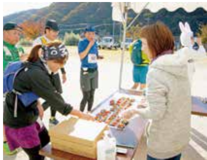
湯川コミュニティセンター(エイド 66kmの部)