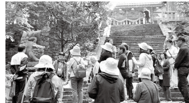
▲丑寅神社の歴史に耳を傾ける参加者

参加者からは「知らない歴史や文化を知ることができ、とても楽しかった」「次回は違うコースも歩いてみたい」といった感想が聞かれ、庄原市の貴重な歴史の一面に触れる一日になりました。