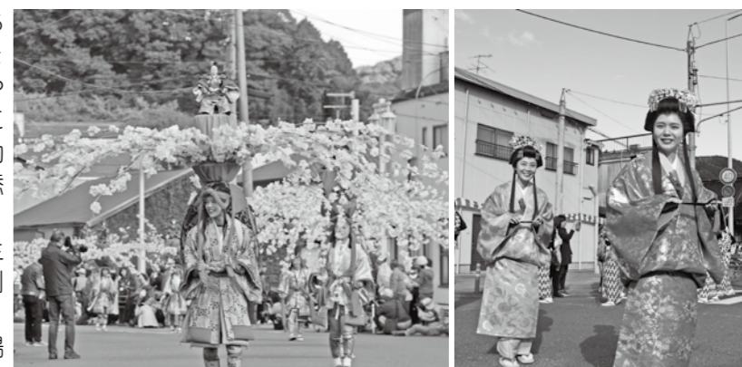
▲大名武者行列と21体の母衣が町並みを歩く(お通り)

サザンカで飾りつけた矢よけの武具「母衣」をはじめ、大名、武者、華童子など総勢約110人からなる行列が市街地を練り歩き、沿道は市内外から訪れた約2万人もの見物客やカメラ愛好家でにぎわいました。