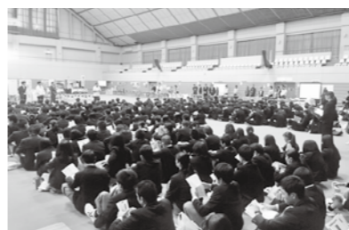
熱心に話を聞く生徒たち

10月25日、庄原市総合体育館で「庄原でいきいき働く就職ガイダンス」を開催し、市内の事業所など45社が参加しました。午前は、「庄原合同ジョブガイダンス」と題し、市内の高校生約260人が企業ブースを巡り、各企業の事業内容や技術について説明を聞きまし 午後、UIJターン希望者と一般求職者を対象に、合同就職面接会を実施し、20人が参加しました。参加した高校生は、「実際に就職したら楽しそうだなと思う事業所があった。とても良い機会になった」と話していました。