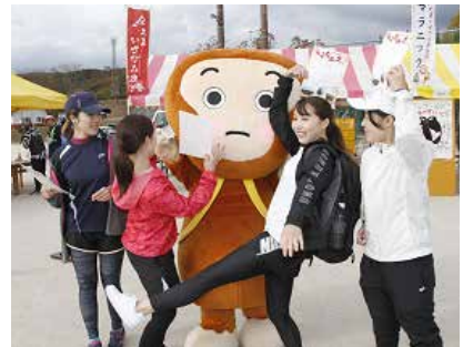
メイン会場に駆けつけたヒバゴンと